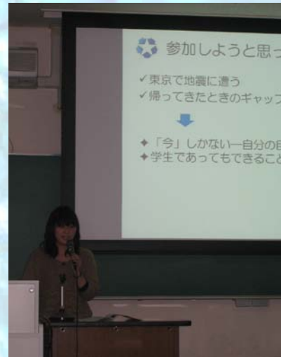
〔報告1〕東日本大震災被災地復興支援活動：岩手県釜石市