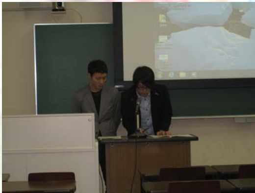
〔報告2〕東日本大震災被災地復興支援活動：宮城県本吉郡南三陸町