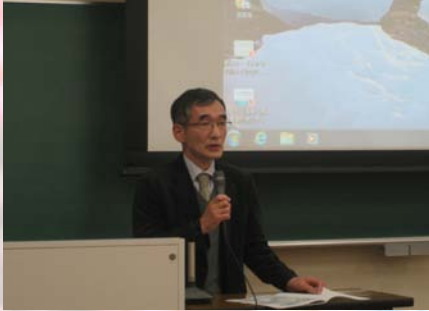
開会挨拶：総合教育センター長