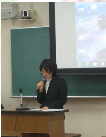
〔報告3〕東日本大震災被災地復興支援活動： 岩手県上閉伊郡大槌町